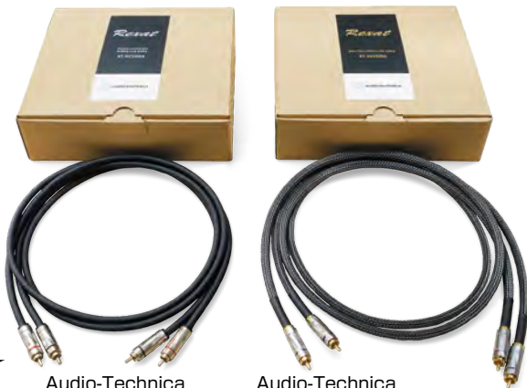
Audio-Technica ハイブリッド ラインケーブル(左) AT-RX3500A/1.3 価格: 2万8600円(1.3m)

カーオーディオでケーブルを変えると効果は、半信半疑に受け止められがちだ。音源やスピーカー、アンプの違いは分かりやすいが、信号を通すだけの存在にどれほどの差があるのか。そう思っていたのも事実である。しかし今回試したオーディオテクニカのレグザットシリーズ、『AT-RX3500A』と『AT-RX4500A』は、その印象を大きく覆した。